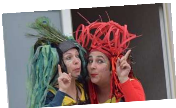
Théâtre des Origines

Les réjouissances se poursuivront tout au long du banquet de mariage !