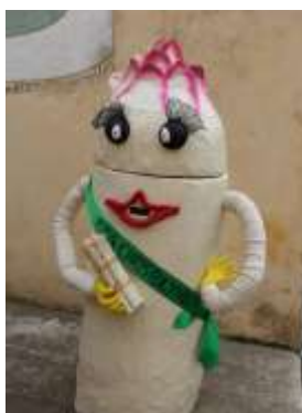
L'asperge de St-Christoly (33) Témoin de la Baragogne