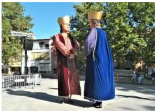
St Côme et St Damien D'Argèles sur Mer