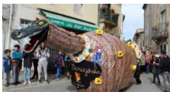
La Baragogne de St-Christol