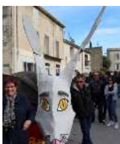
Le Tamarou de Vendargues