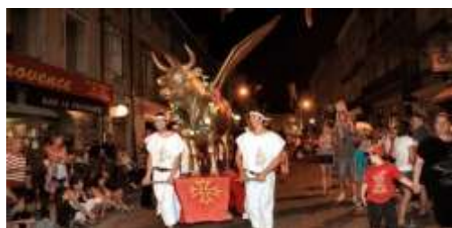
Le Volo Biou de St Ambroix (30) (Témoin du Tamarou)