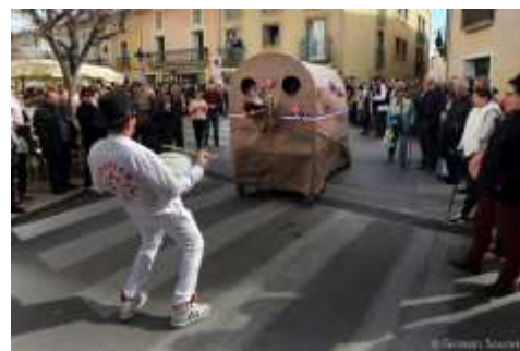
Le Loup de Loupian (Témoin du Tamarou)